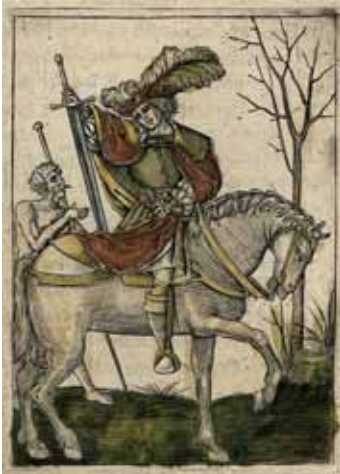
© St. Martin, Flämisches Gebetbuch, frühes 16. Jhd.