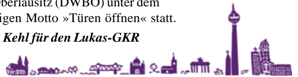
Grafik: Diakonie Berlin, Brandenburg, schlesische Oberlausitz