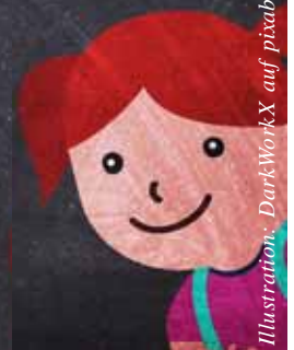
Illustration: DarkWorkX auf pixabay